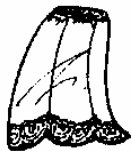
2. a meia combinação half slip