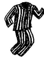
7. o pijama pajamas