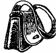
6. a bolsa purse