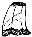
2. a meia combinação half slip