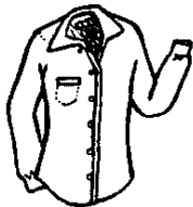
1. a camisa shirt