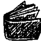
6. a carteira wallet