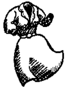
1. o vestido dress